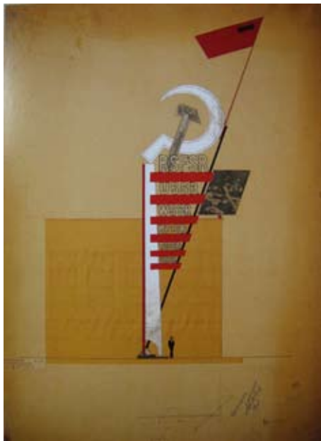
Schwert eines Flaggenmastes für den Sowjetischen Pavillon auf der Weltausstellung in Moskau, 1939. Fotokopie auf Papier, Gouache, Tinte, Staatliche Tretyakov-Galerie, Moskau, Kat. 58